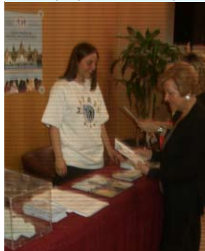
II Jornada de Atención a la Salud Sexual y Reproductiva - Tarragona