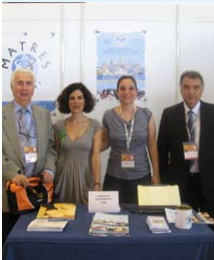
XXII Congreso Europeo de Medicina Perinatala - Granada