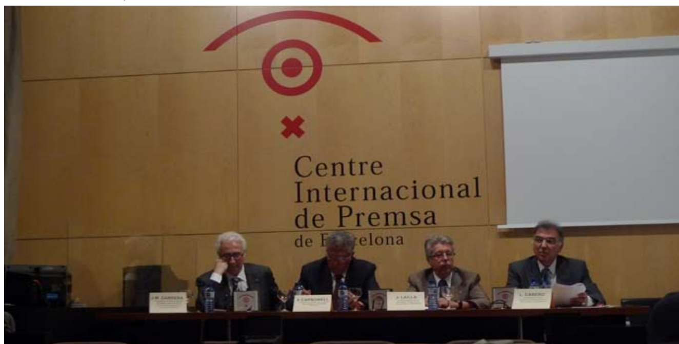
Presentación del Llamamiento a la Ciudadanía