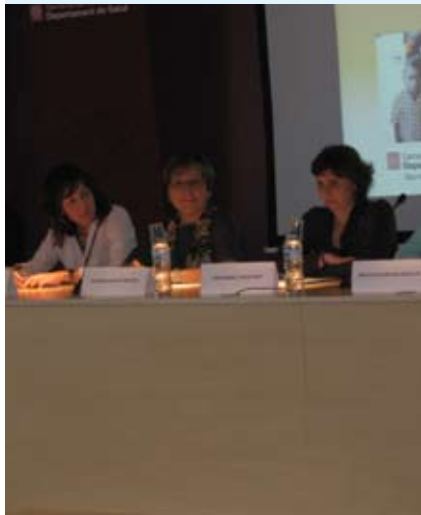
I Jornada de Enfermería y Cooperación Barcelona